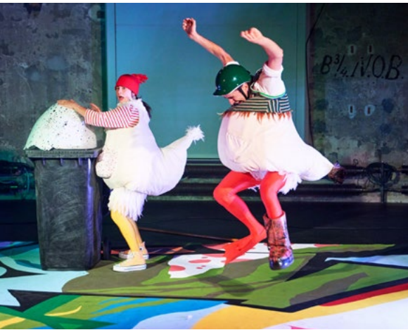
Lahme Ente, Blindes Huhn Kindertheater