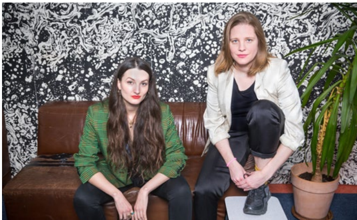
Lappert / Berther Spoken Sound Poetry