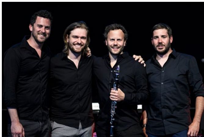
Gläuffig Konzert