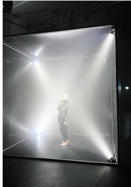
Murgang Performance