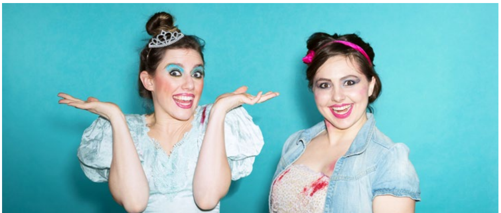
9 Volt Nelly Kabarett