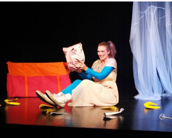
Sonja Silber Theater