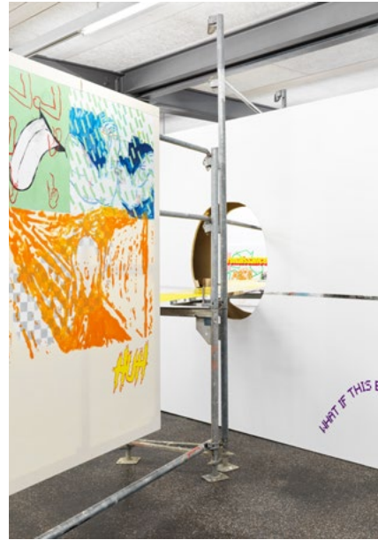
Aramis Navarro Ausstellung