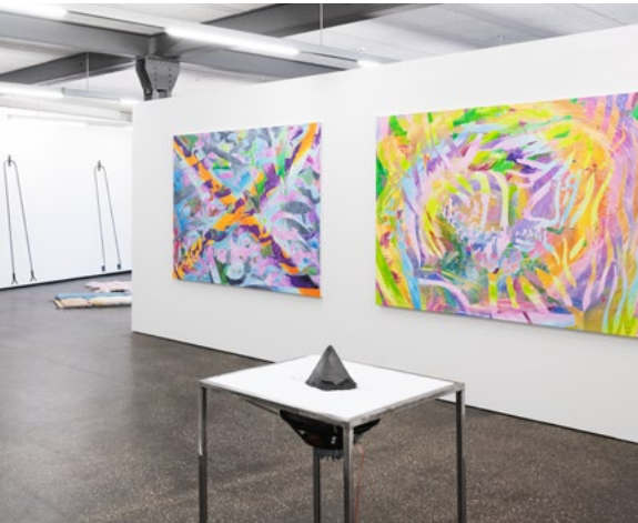
Grosse Regionale Ausstellung