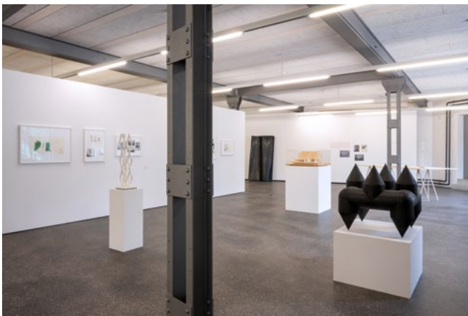
Die Organisation der Leere Ausstellung © Manuela Matt