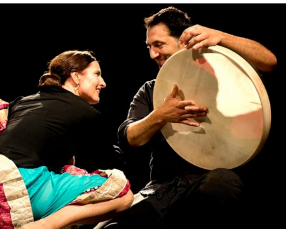
Castaño / Coksun Tanz & Musik