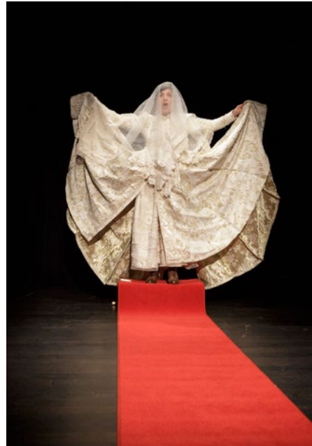
Lydia Theater