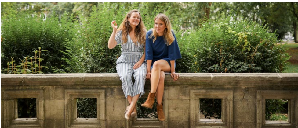
Tales for my mother Musik © Laura Kist