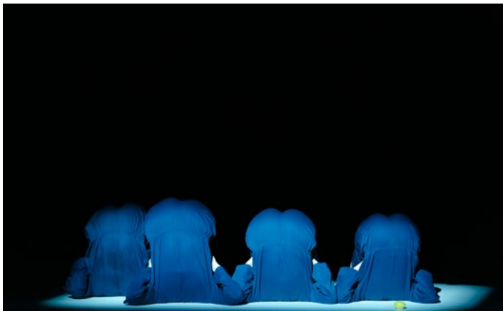
Z.trone Tanzperformance