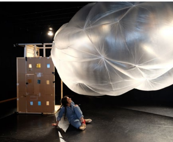
Wolke Kindertheater