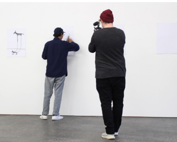
Fabrik*Stream Digitale Präsentation