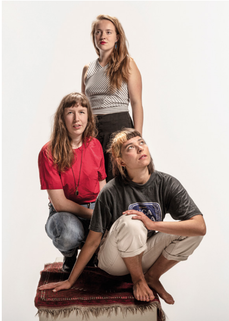
Tie Drei Musik