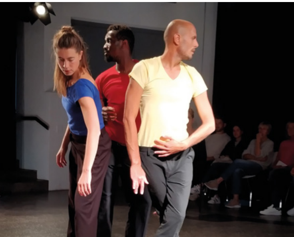
Wir könnten fliegen, wollten wir Tanzstück