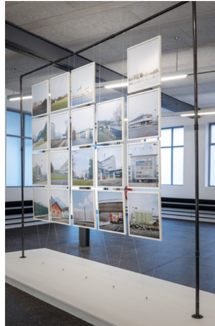
Bestimmt Ausstellung © Manuela Matt