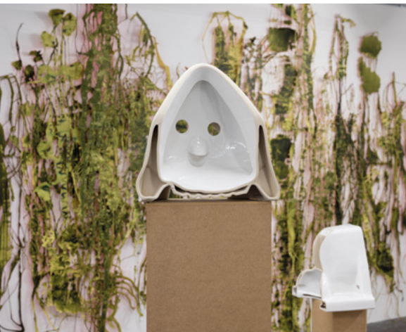
Grosse Regionale Ausstellung