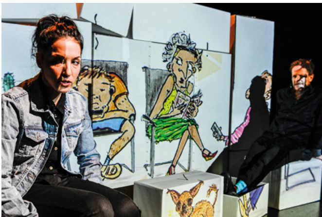
Not Interesting Kabarett