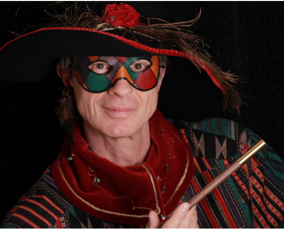
Fausto Merlini Schauspiel © Lotti Brechbühler