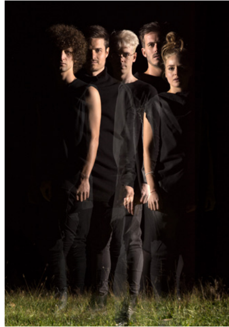
Ikarus Musik / © OBaumann