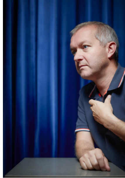
Wahrhalsig Kabarett