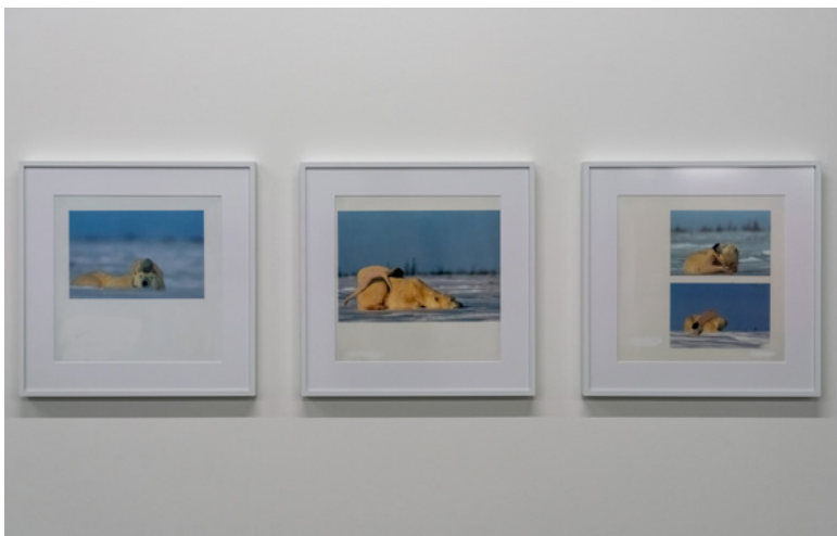
Sunaura Taylor, Wildlife (2014) Ausstellung