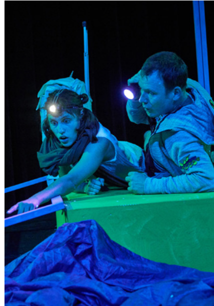
Kuno kann alles Kindertheater