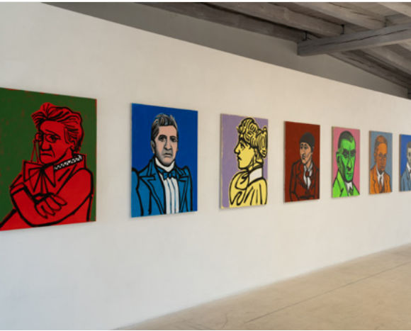
Poczeta - Karol Radziszewski Ausstellung