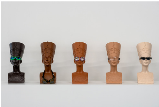
Eat the Museum - Ramaya Tegegne Ausstellung