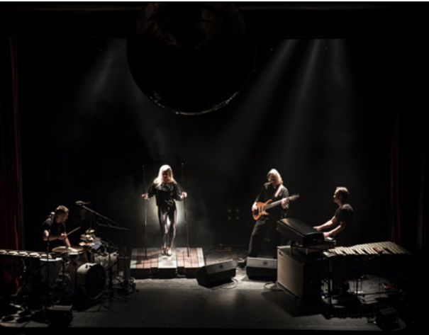
Losinger Eser Meyer Bosshard Musik © Gian Losinger