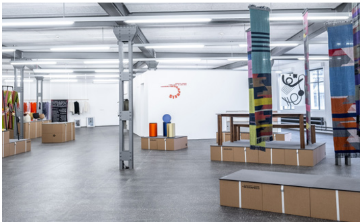
Designpreis Ausstellung