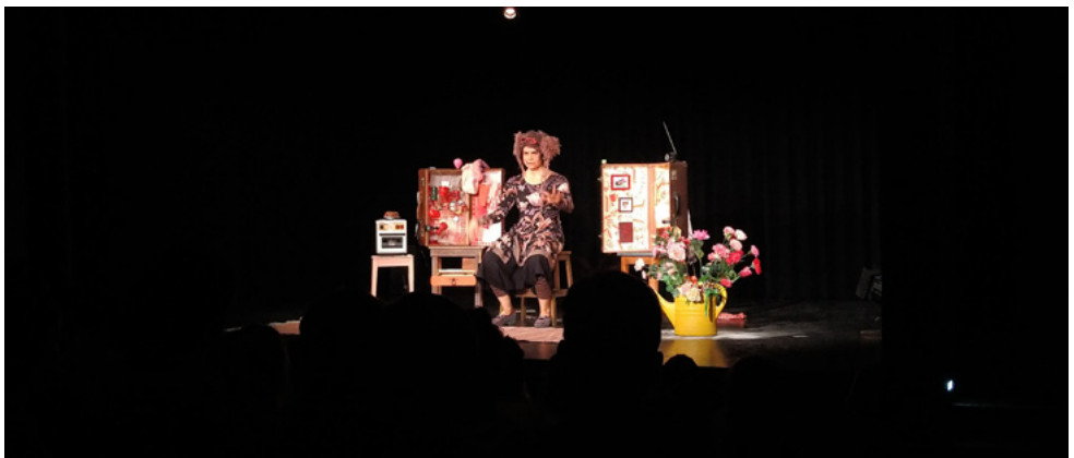
TheaterLenz Kinder-/Jugendtheater